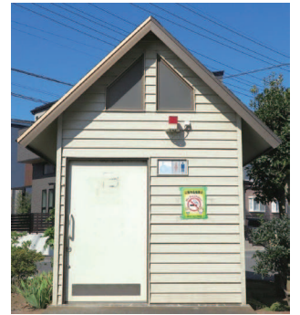
馬込九番公園のトイレ

答弁 当初の工事期間は妥当であったと考えておりますが、工事着手後予見できない状況が確認されたことから、工事期間の延長を行ったものでございます。また、簡易トイレの設置については、事前に張り紙により工事について周知したと考えておりましたが、配慮が十分でなかったと認識しています。今後の工事につきましては、工事手法の再検討により、利用者に対し一層の配慮に努めてまいります。