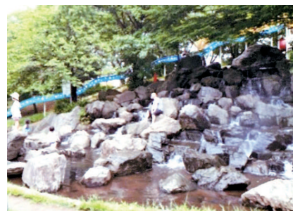
根ヶ谷戸公園の親水施設

答弁 平成4年度開設された 西城沼公園 は令和元年度以降、また 綾瀬せせらぎ公園 は平成6年度開設以降の数年間を除いて稼働していない状況です。西城沼公園は地下水を、また綾瀬せせらぎ公園は見沼代用水を利用する施設であり、いずれも水質管理が課題となり稼働を見合わせております。開設以降、継続して運用ができていないため、開設当初の目的を十分に達成できていない状況です。