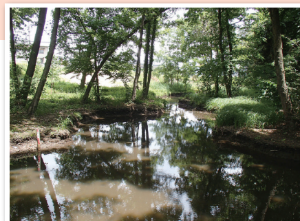
国指定史跡黒浜貝塚

答弁 令和2年2月上旬の文化庁補助金内定額通知により全面供用開始時期が左右されることと考えております。令和2年度を工事の最終年度と位置付けできるよう頑張りたいと考えています。